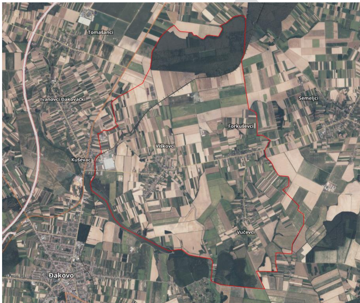
Karta Općine Viškovci

Lokalna naselja koja spadaju pod Općinu Viškovci su: Viškovci, Forkuševci i Vučevci.